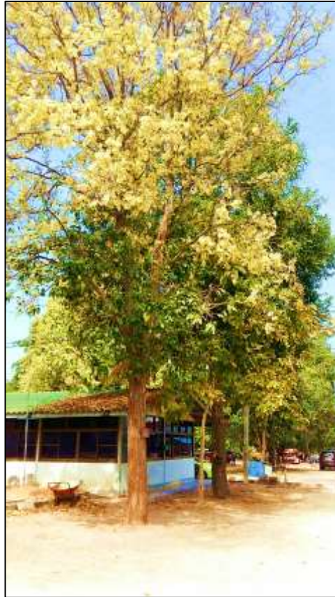
“ต้นพะยอม”